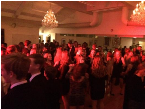
Trivselstiltak på EUS- Juleball