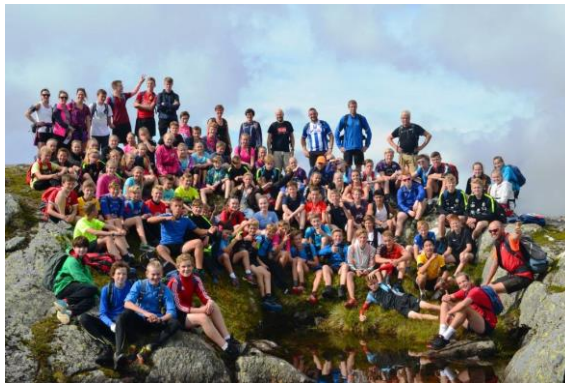
Fjelldag for alle tre trinna ved EUS