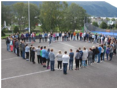
Samhald gjer sterk...

Delar av informasjonsheftet og informasjon, m.a. nyhende, planar og bilete er å finne på heimesida vår: http://eus.no . Elevane kan der finne inngang til læringsplattforma Fronter. Likeeins kan ein finne 14 dagars arbeidsplanar, halvårs- og vekeplanar.